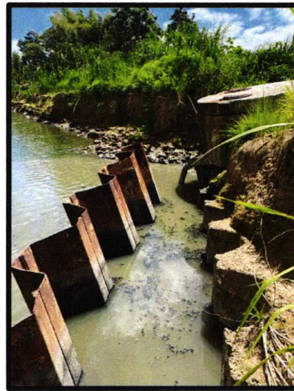
Figura 2. Registro Sanitario Colapsado Figura 3. Desplazamiento de Tablestaca