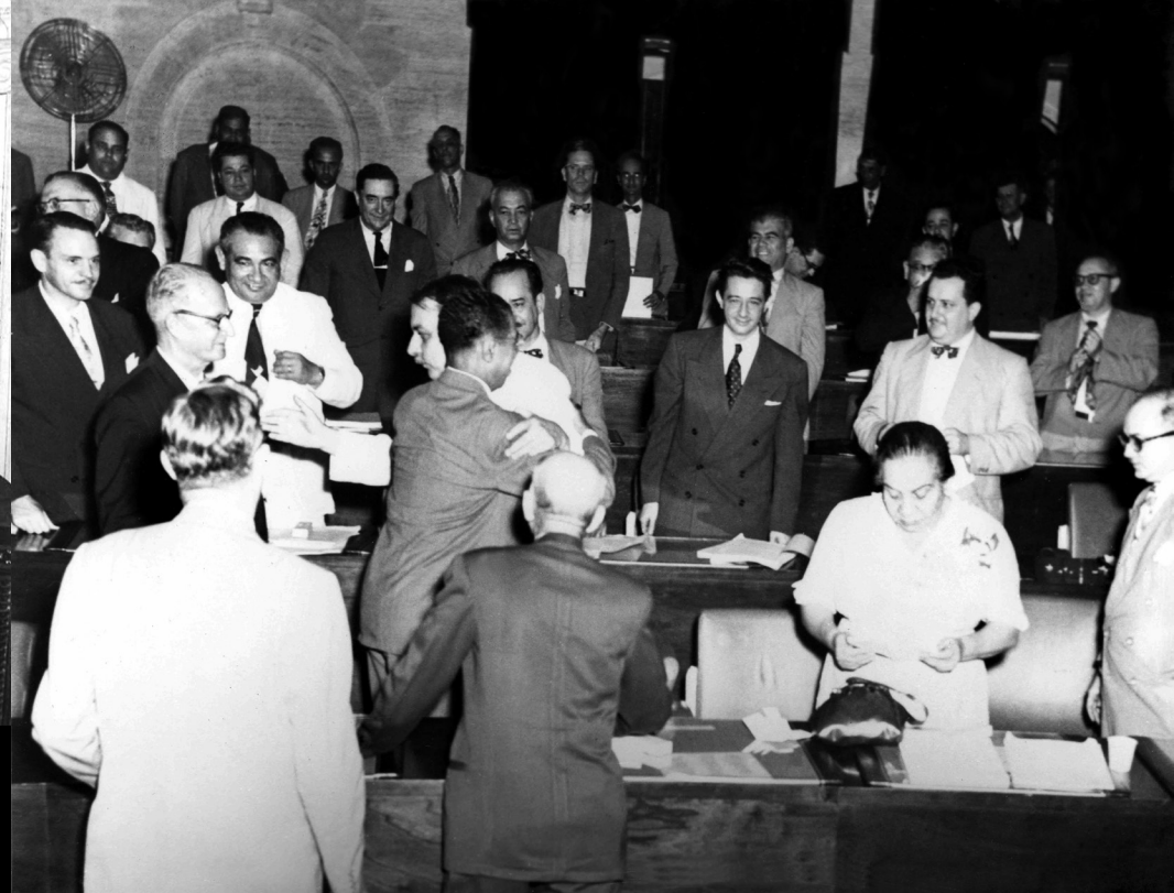
Los delegados Luis Muñoz Marín y Leopoldo Figueroa se abrazan al finalizar los trabajos de la Convención Constituyente el 6 de febrero de 1952.