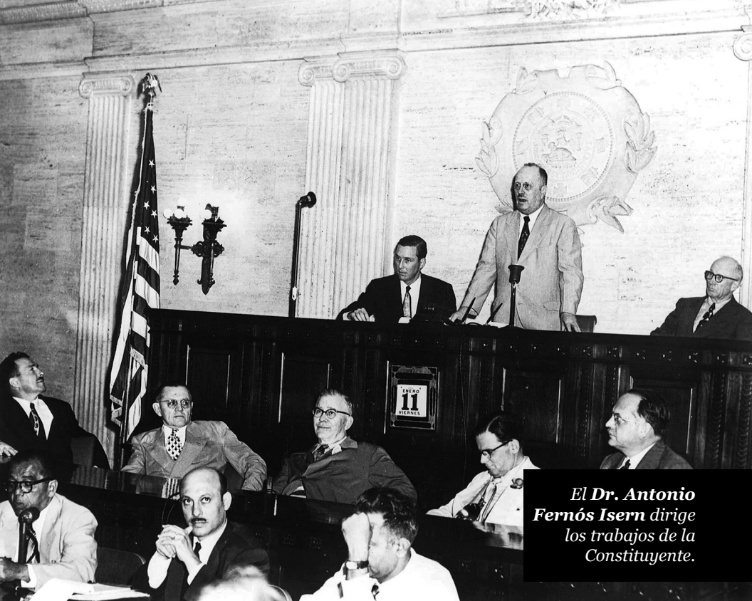
El Dr. Antonio Fernós Isern dirige los trabajos de la Constituyente.