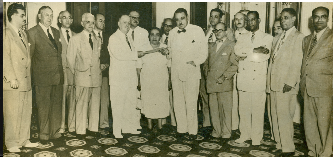
Los jueces del Tribunal Supremo de Puerto Rico (izquierda) y varios delegados de la Convención Constituyente acompañan al Dr. Antonio Fernós Isern durante la entrega de la Constitución al gobernador, Luis Muñoz Marín.