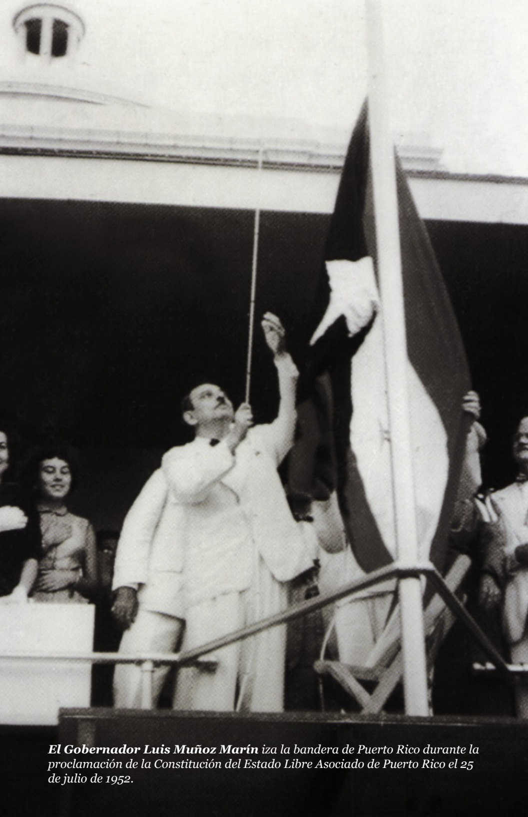
El Gobernador Luis Muñoz Marín iza la bandera de Puerto Rico durante la proclamación de la Constitución del Estado Libre Asociado de Puerto Rico el 25 de julio de 1952.