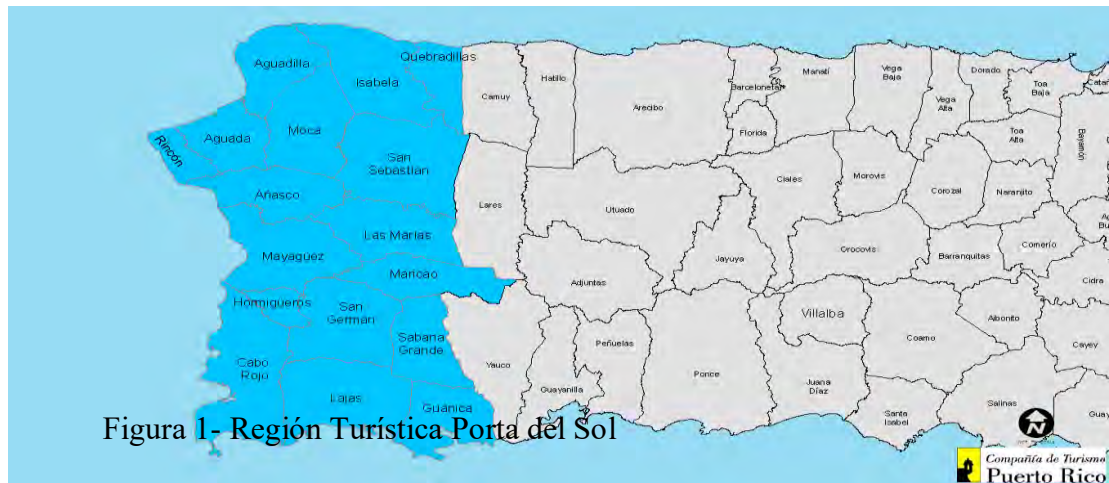
Figura 1- Región Turística Porta del Sol

Maricao, Mayagüez, Moca, Rincón, Sabana Grande, San Sebastián y Quebradillas (Fig.1). Posteriormente, para el año 2007 y bajo mandato de la Ley Núm. 176 del mismo año, se añadió al Municipio de San Germán para que formara parte de este grupo.