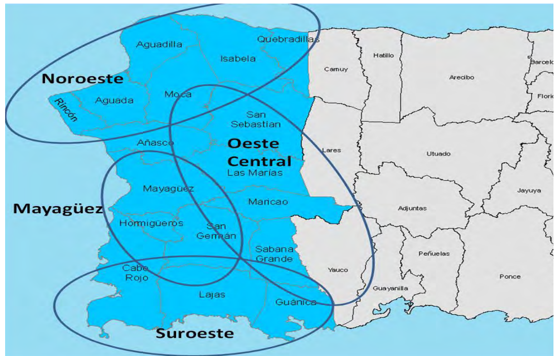
Figura 2. Las cuatro subregiones de Porta del Sol

Actualmente, la zona brinda a sus visitantes una oferta variada que incluye: turismo de aventura, cultural, gastronómico, deportivo, ecoturismo y religioso.