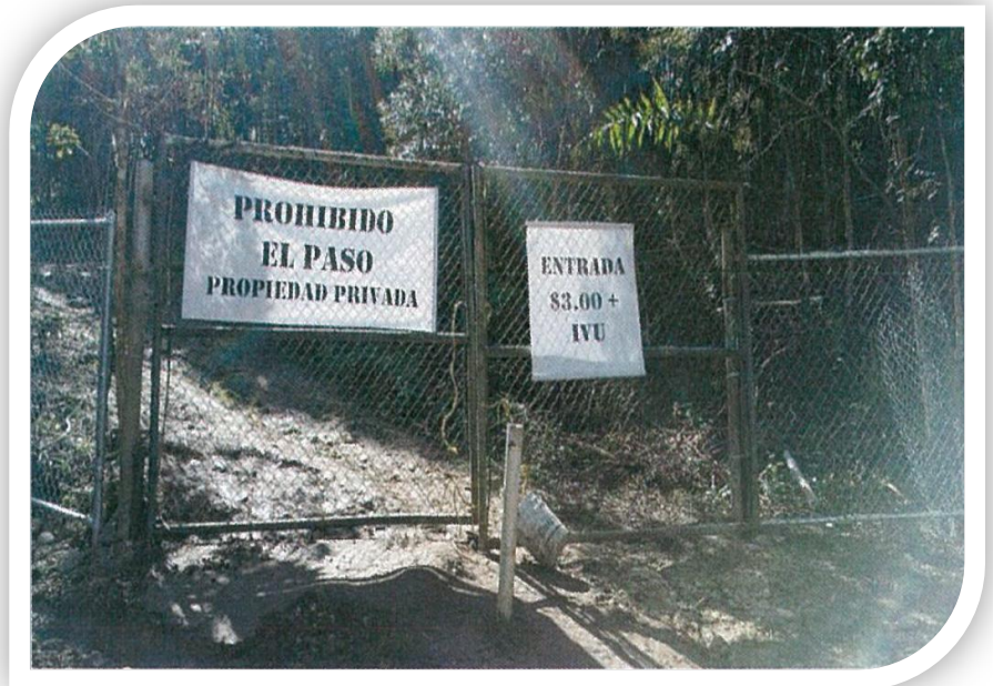
Figura 3 Portones de Cueva Ventana