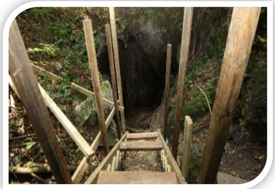
Figura 4 Construcción en Cueva Ventana