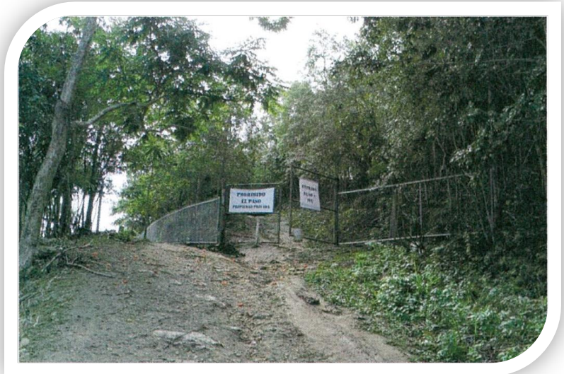
Figura 2 Portones de Cueva Ventana

Protección y Conservación de Cuevas, Cavernas o Sumideros de Puerto Rico”, y a la Ley Núm. 241-1999, según enmendada, conocida como “Ley de Vida Silvestre de Puerto Rico”.