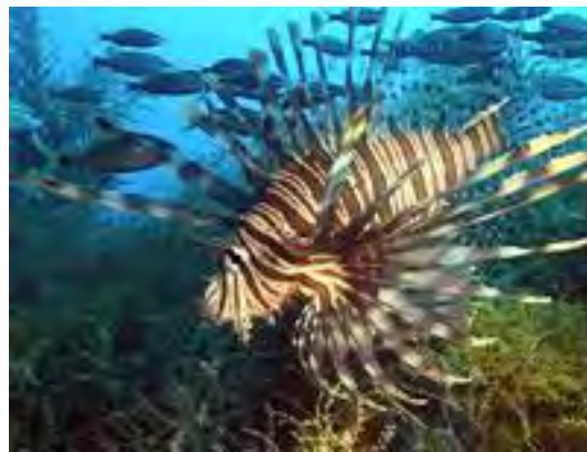
Pez león ( Pterois volitans )

El proceso de informes sobre la presencia del pez león en el Océano Atlántico comienza con un pescador de langostas, que informó un avistamiento en 1985 en el sureste de Florida.