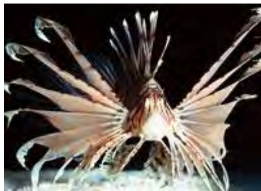
Pez león expandiendo y utilizando